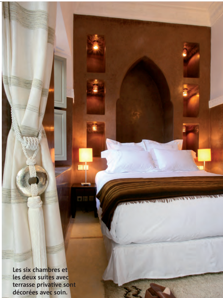
Les six chambres et les deux suites avec terrasse privée sont décorées avec soin.