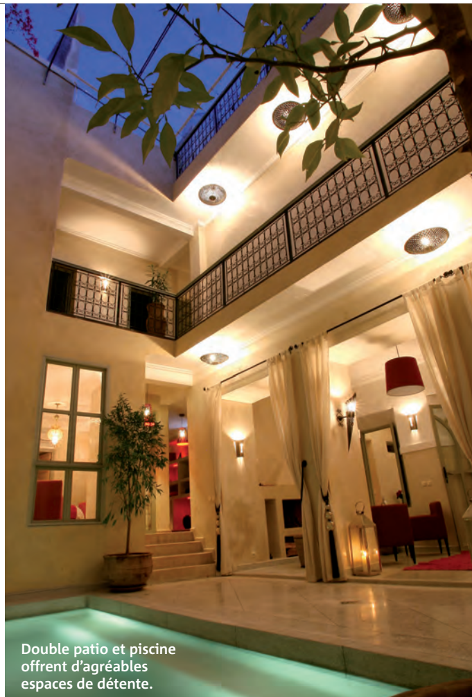
Double patio et piscine offrent d'agréables espaces de détente.