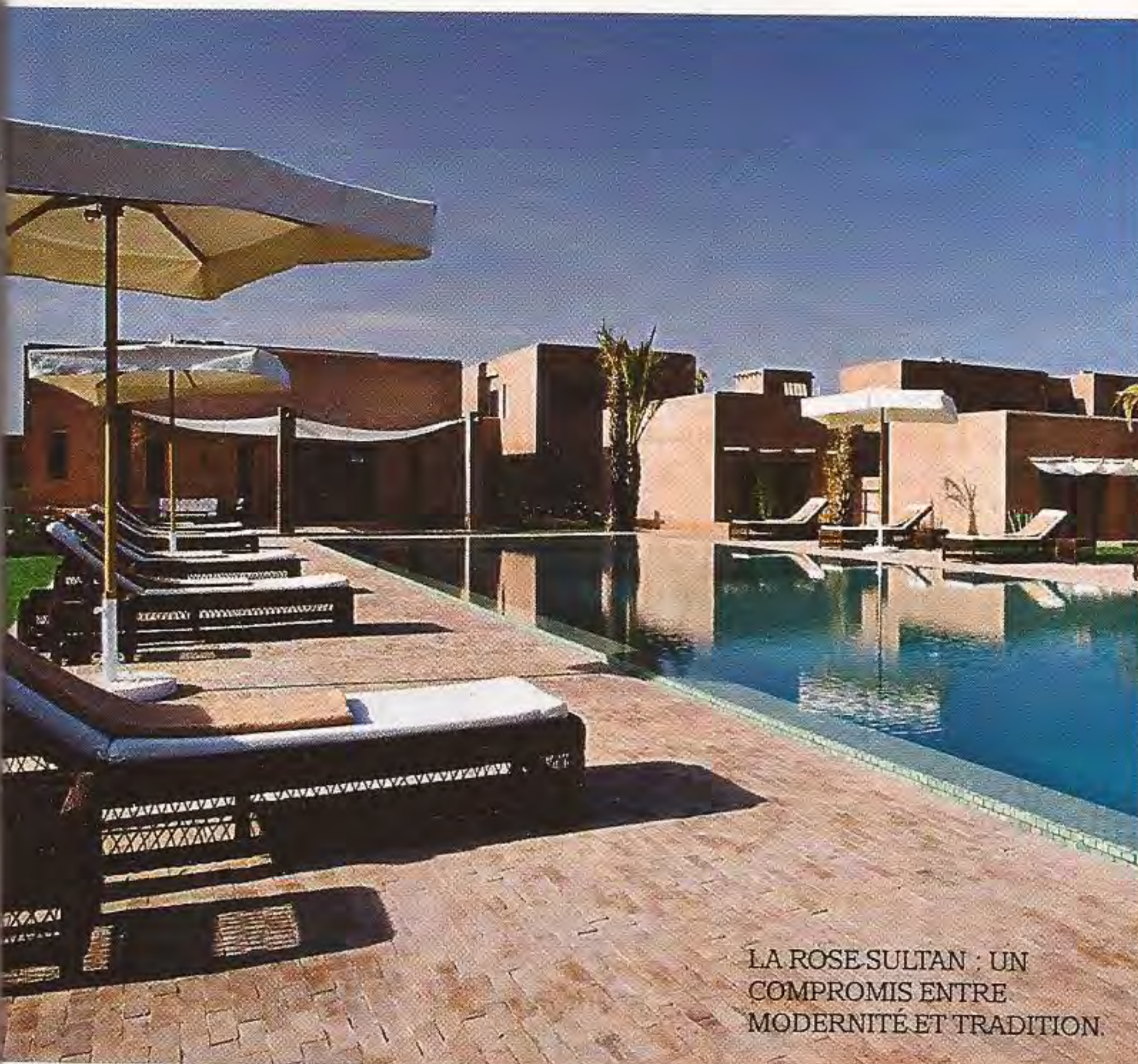
LA ROSE SULTAN : UN COMPROMIS ENTRE MODERNITÉ ET TRADITION.